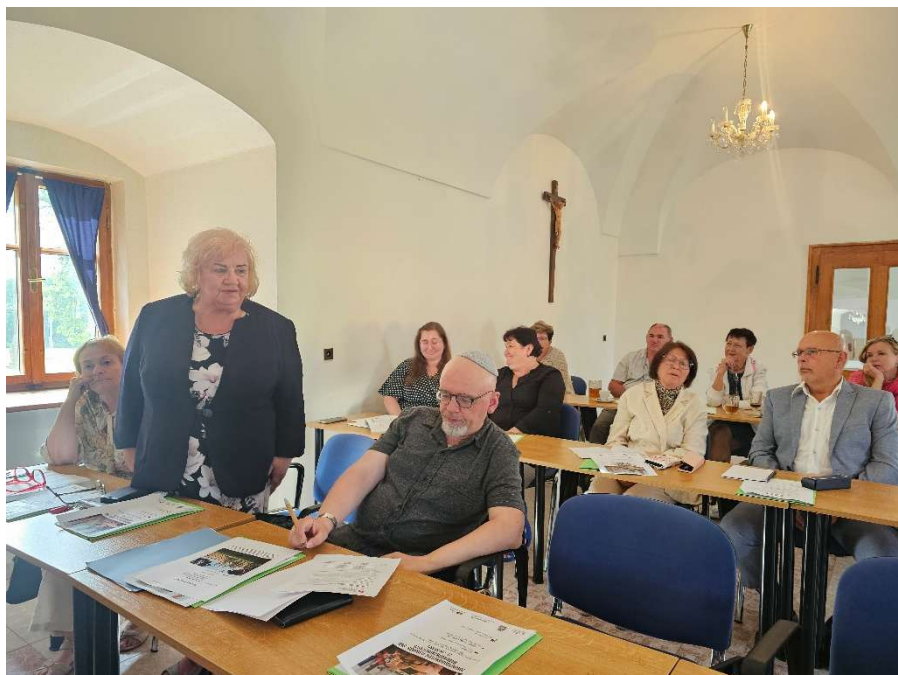
Blick ins Plenum